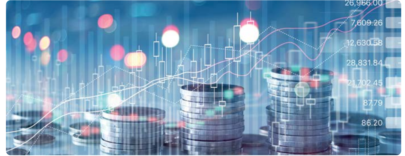
Şişecam Hisse Senetleri BIST-100 Endeks Bazında Değişimi (2020)

2020 yıl sonu itibarıyla BIST Holding Endeksi %29, BIST-100 Endeksi %29 ve BIST-30 Endeksi %18 değer kazanmıştır. Aynı dönemde, ana faaliyet sektörlerinde COVID-19 sebebiyle görülen olumsuzluğun başarılı kriz yönetimi ve dengeli portföy dağılımı ile ikinci çeyrele sınırlı kalması neticesinde özellikle Haziran ayından itibaren faaliyetlerde kaydedilen hızlı toparlanma ve birleşme işleminin pozitif fiyatlanması sonucu Şişecam hisse senetleri %43 değer kazancıyla endeks üzeri performans sergilemiştir.