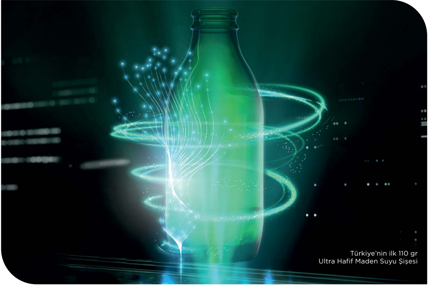
Türkiye'nin ilk 110 gr Ultra Hafif Maden Suyu Şişesi

Devam eden Rusya-Ukrayna savaşı, ABD-Çin eksenli ticari gerilimler, küreselleşmeden çok kutuplu dünya düzenine geçiş süreci, enerji kaynaklarına erişim ve fiyatlandırma gibi iç içe geçmiş unsurlar belirsizlikleri artırmaktadır. Mevcut belirsizlik, ortamın sürdürülebilirlik, çevre ve iklim değişikliği ile mücadele, arz güvenliği gibi konularda küresel düzeyde iş birliği olanaklarını güçleştirmektedir.